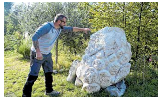
Kameni grozd - još jedan simbol Vinodola